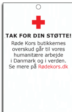
Mellem - 7 cm x 4,5 cm