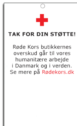
Stor - 9 cm x 5,5 cm