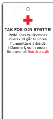
Lille - 7 cm x 3 cm

På bonens bagside vil Røde Kors' 7 principper ligeledes være listet. Det er en god mulighed for at få brandet Røde Kors, og de fantastiske principper I står for.